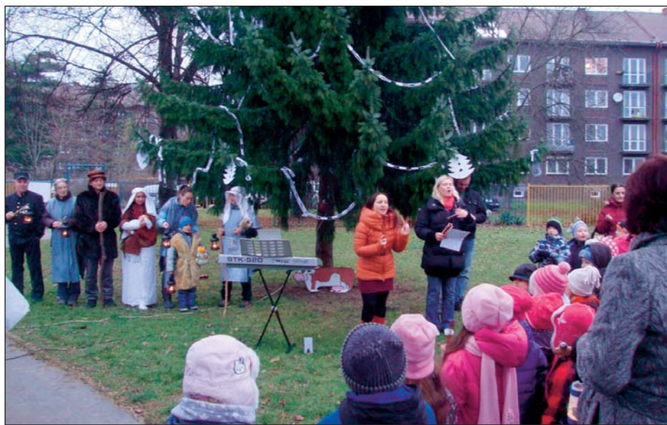
DĚTI z MŠ Zelená pozvaly seniory na slavnostní rozsvícení vánočního stromu v prostorách krásné zahrady mateřské školky.